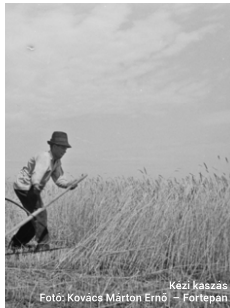
Kézi kaszás

Szent Pétert a halászkok patrónusaként tisztelték, s az egykori halászcéhek