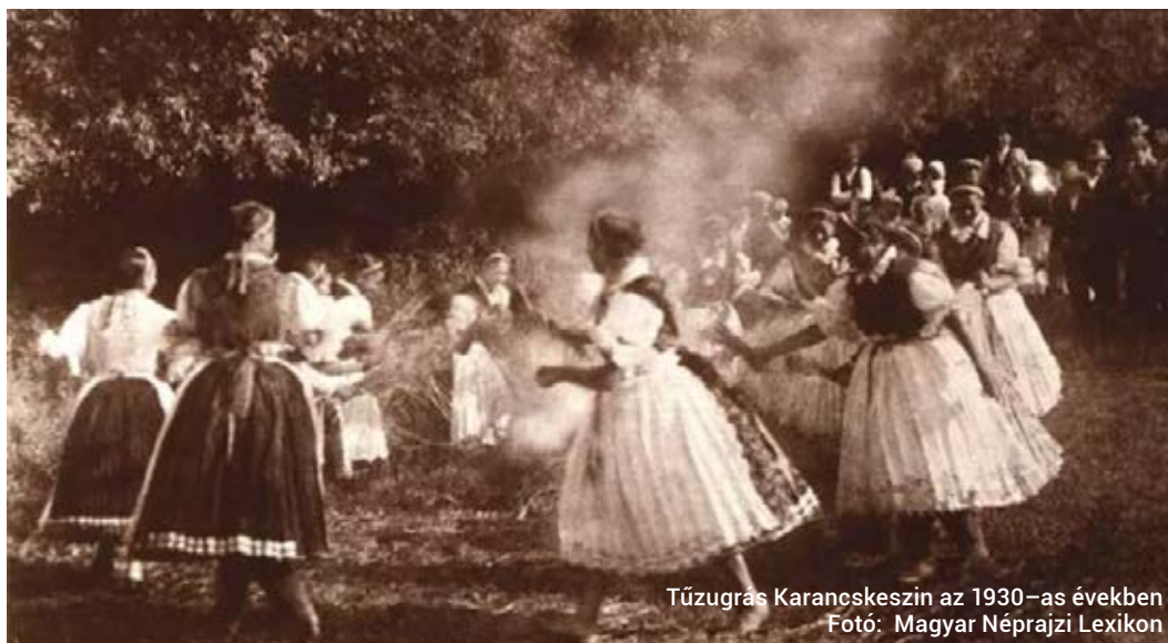
Tűzugrás Karancseszén az 1930-as években

https://vaskarika.hu/hirek/reszletek/5220/juniusi_hiedelmek_nepszokasok/