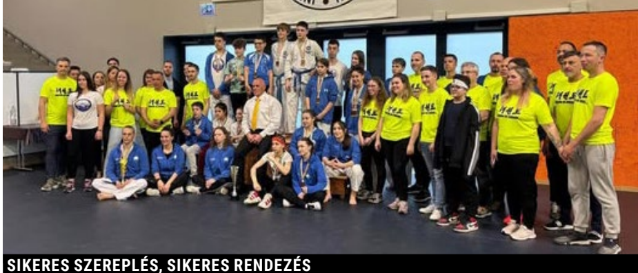
SIKERES SZEREPLÉS, SIKERES RENDEZÉS