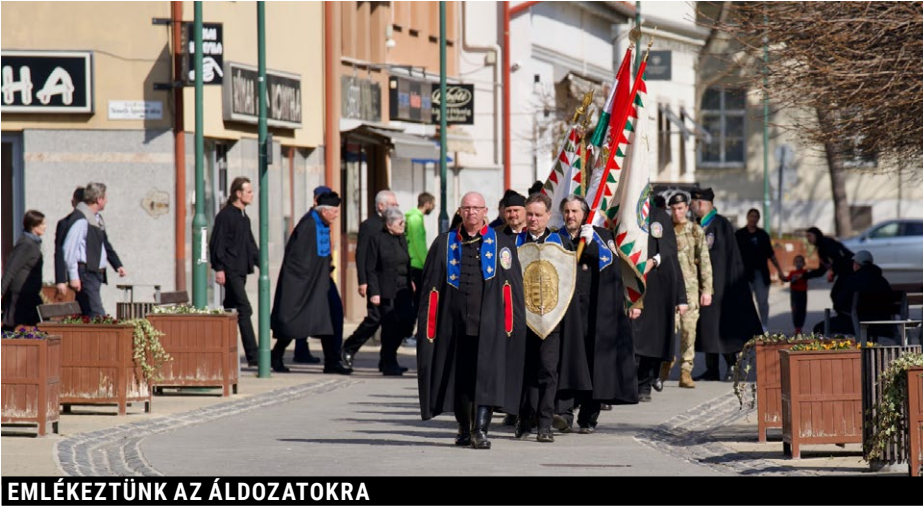
EMLÉKEZTÜNK AZ ÁLDOZATOKRA