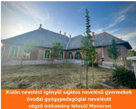
Külön nevelést igénylő sajátos nevelésű gyermekek óvodai gyógypedagógiai nevelését végző intézmény létesül Monoron

Az épületet Monor Város Önkormányzata térítésmentesen biztosítja a Monori Tankerületi Központ részére, ezzel is hozzájárulva a gyermekek helybeli fejlesztésének elősegítéséhez. Az intézmény szeptembertől, várhatóan két csoporttal fog indulni. Bővebb tájékoztatást ezzel kapcsolatban a Monori Tankerületi Központ tud adni.