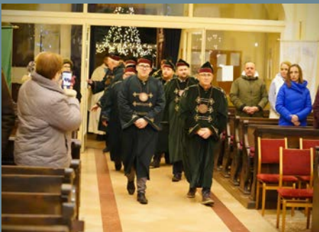
JÁNOS-NAPI boráldás Monoron