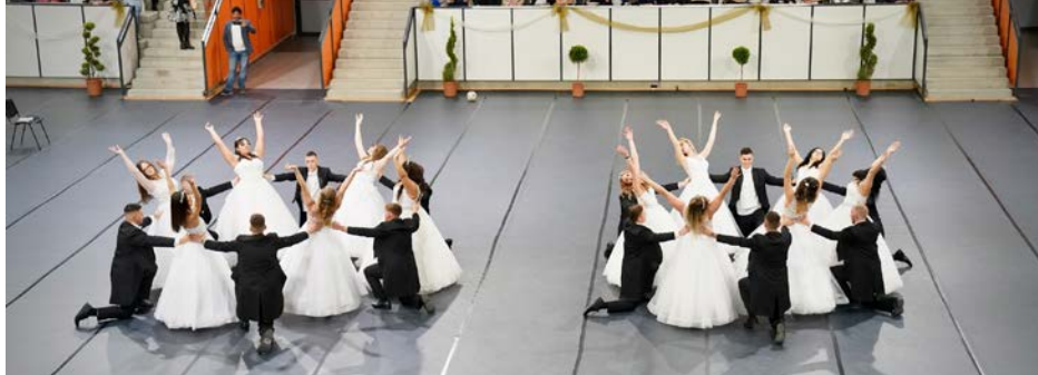
KÁPRÁZATOS ESEMÉNY VOLT