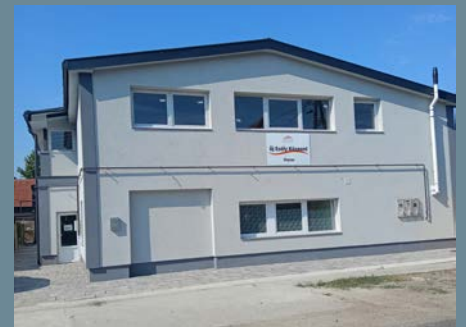
EGY ESÉLY AZ újrakezdésre