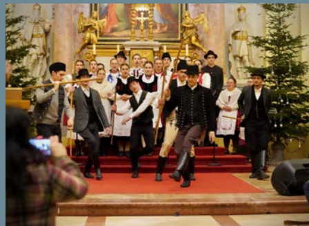
Így telt az ADVENTI IDŐSZAK