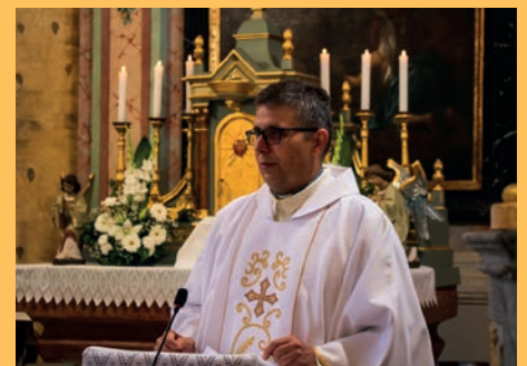
ÚJ KATOLIKUS PAPT köszönt a város