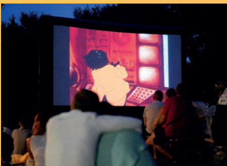
FRÖCCSSZOMBAT és PikNik Mozi