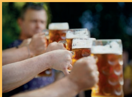
Így teltek a CSEH KULINÁRIS NAPOK