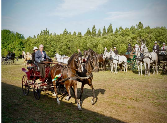
41 FOGAT VERSENYEZETT NYOLC KATEGÓRIÁBAN