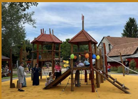
A NAPSUGÁR ÓVODA kibővült és megújult