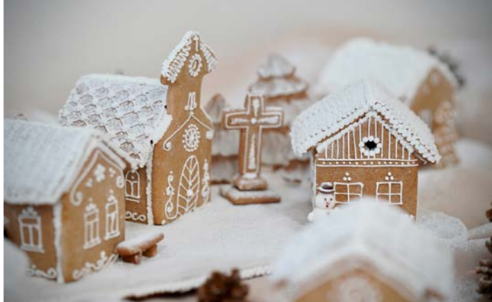
A SZAKKÖRÖK ALKOTÁSAIT BÁRKI MEGTEKINTHETI