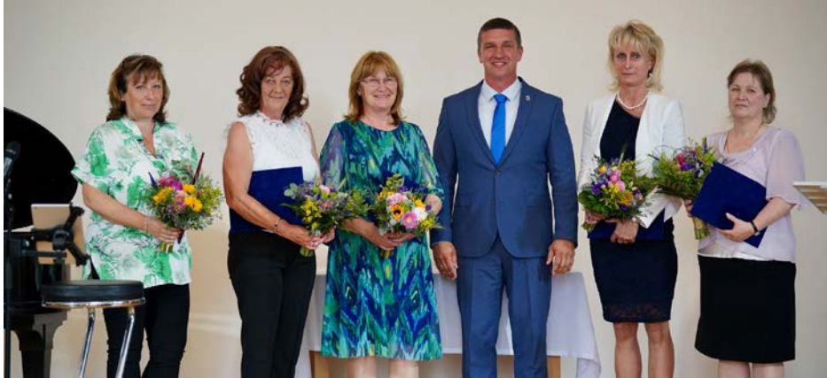
"AZ OKTATÁS NEM AZ ÉLETRE VALÓ FELKÉSZÍTÉS; AZ OKTATÁS MAGA AZ ÉLET" /JOHN DEWEY/