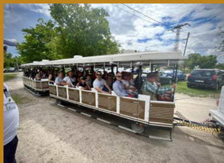
Ilyen volt 2023-ban a BORVIDÉKEK HÉTVÉGÉJE