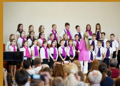
ÉVZÁRÓ a zeneiskolákban