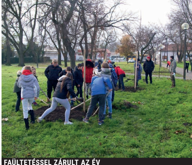
FAÜLTETÉSSSEL ZÁRULT AZ ÉV