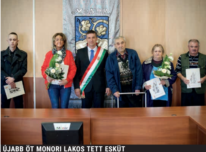
ÚJABB ÖT MONORI LAKOS TETT ESKÜT