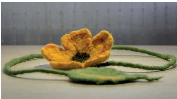
ÉKSZEREKET KÉSZÍTHETNEK AZ ÉRDEKLŐDŐK