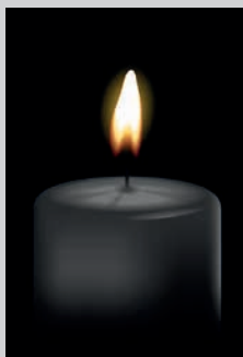
A gyászoló család