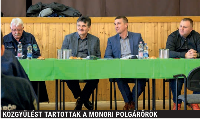
KÖZGYŰLÉST TARTOTTAK A MONORI POLGÁRŐRÖK