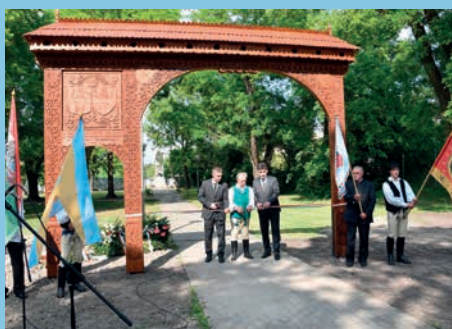
SZÉKELYKAPUT AVATTAK a monori Gera-kertben