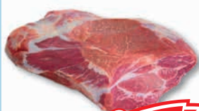
Sertésárja csont nélkül