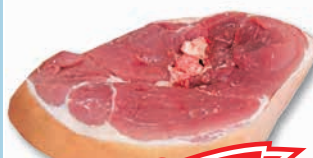
Bőrös sertéscomb szelet