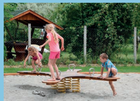
ÁTADTÁK A Szent Orbán téri játszóteret