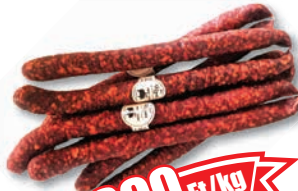
Kurucz füstölt kolbász