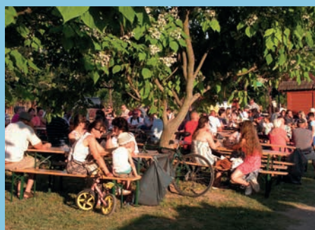
Rendhagyó, de sikeres volt A BORVIDÉKEK HÉTVEGÉJE