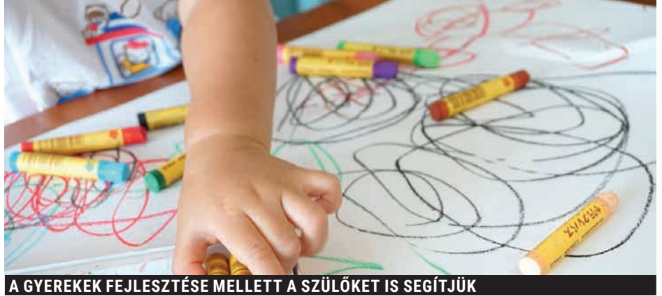
A GYEREKEK FEJLESZTÉSE MELLETT A SZÜLŐKET IS SEGÍTJÜK