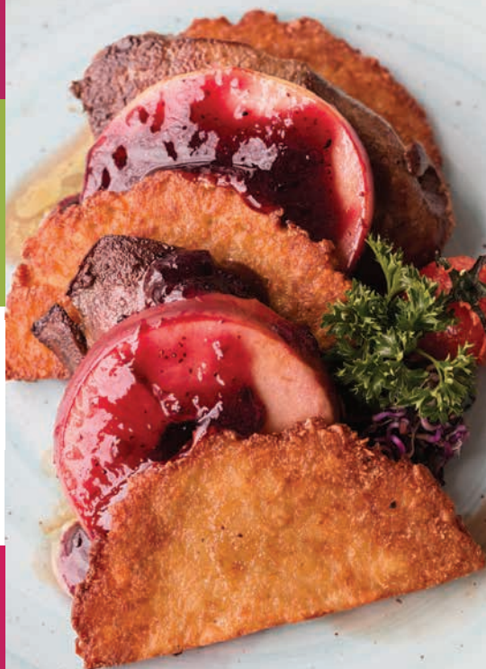
A képek illusztrációk.