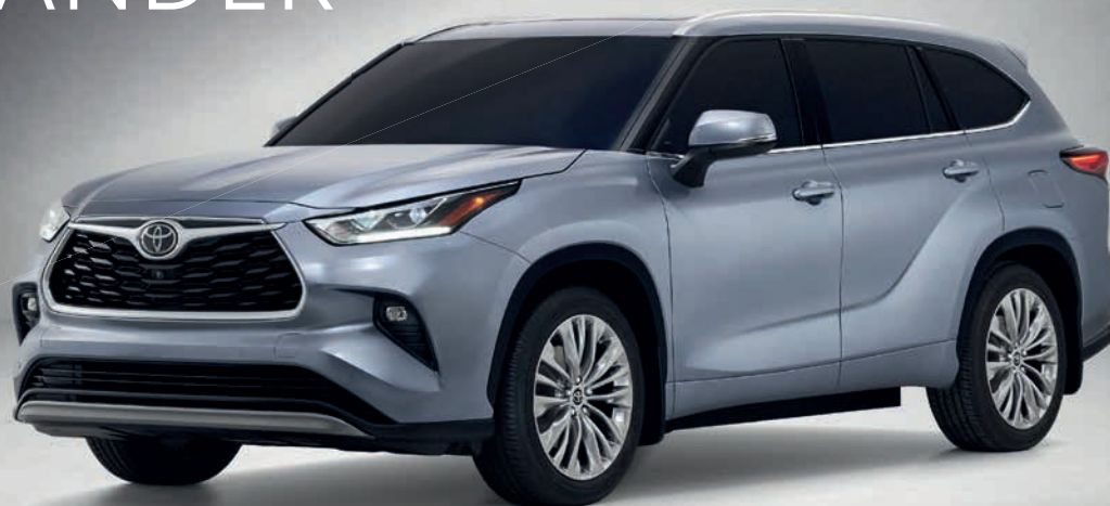
A képen látható autó illusztráció

Ezt a tágas és stílusos, hétüléses SUV-t legújabb hibrid technológiánkkal és intelligens összerékhajtásunkkal (AWD-i) szereltük fel. Nemcsak lenyűgözően kényelmes, hanem erős, takarékos és sokoldalú is, hogy a legaktívabb családok életmódjával is lépést tarthasson. Már előrendelhető, akár nagycsaládos állami támogatás igénybevételével!