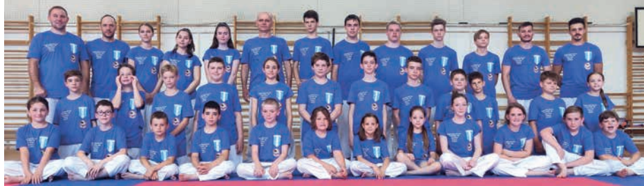
IDÉN VOLT A TIZENNYOLCADIK EDZŐTÁBOR

zajlik; miközben a sportolók és nézők által használt mellékhelyiségek felújítása is folyamatban van.