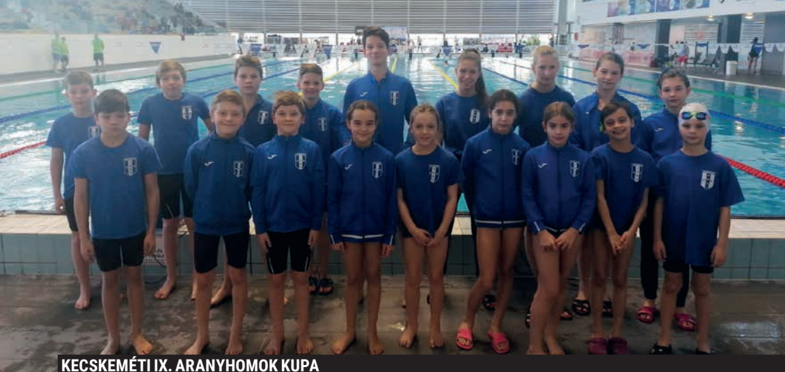
KECSKEMÉTI IX. ARANYHOMOK KUPA