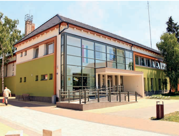
Monor Városi Könyvtár