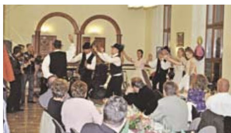
▲ Szüreti bál