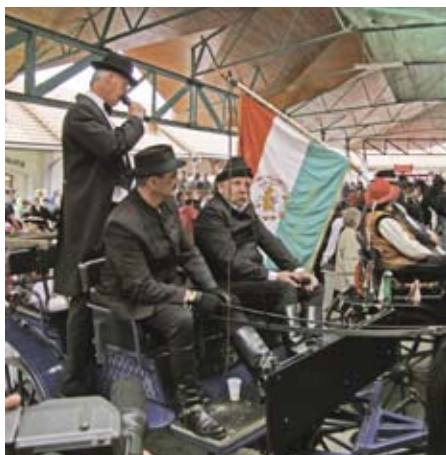
▲ Szüreti felvonulás

A nap minden rendezvénye a meghirdetetteknek megfelelően alakult, a változás mindössze a látványszüret elmaradása volt.