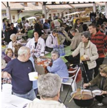
▲ Jótékonyági főzés

Az elmúlt évek jól bevált gyakorlatát követve zajlott idén Monoron a Szüreti Sokadalom, de az eddigi programokat idén a Szüreti bál és egy jótékonyági főzés is kiegészítette.