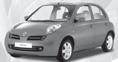
NISSAN MICRA MENTA* MÁR 2 290 000 FT-TÓL