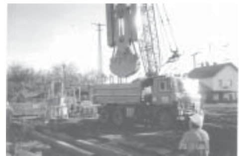
Monor város területén is megkezdődött a Bp. - Cegléd vasútvonal korszerűsítése. Képünkön: résfal készítése a vasútállomáson a gyalogos aluljáró részére.