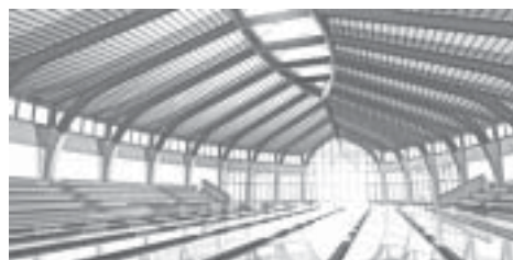
Monor Városi Uszoda

"A tervek valóra váltásának időszaka következik." - írtam januárban. Hogy mennyire sikerült, döntsék el Önök. Mindenesetre az elmúlt évek nyugodt, kiegyensúlyozott gazdálkodása, a helyi politikai erők tisztaságát, együttműködését megalapozta a következő évek biztonságos fejlődését.