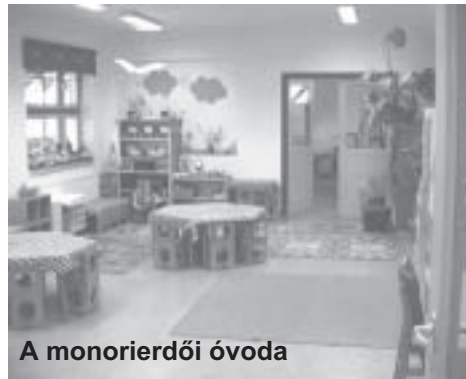
A monorierdői óvoda

arra kértem önöket, hogy véleményeikkel, ötleteikkel segítsék a rövidesen bemutatásra