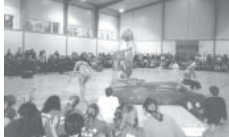
A testnevelési Egyetem ugrócsoportja