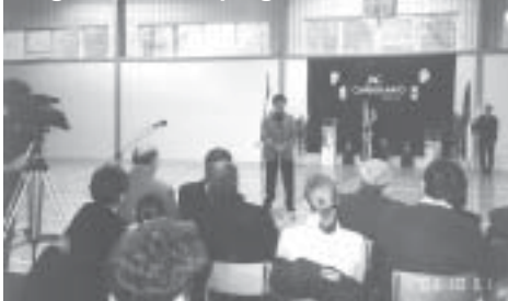
Pogácsás Tibor polgármester

helyettes, testnevelőtanár, települési képviselő számára biztosan felejtethetlen lesz, hiszen ez egész ötlet tőle származott, és oroszlánrészt vállalt a kivitelezés szervezésében is.