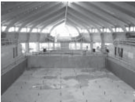
Az uszoda belülről