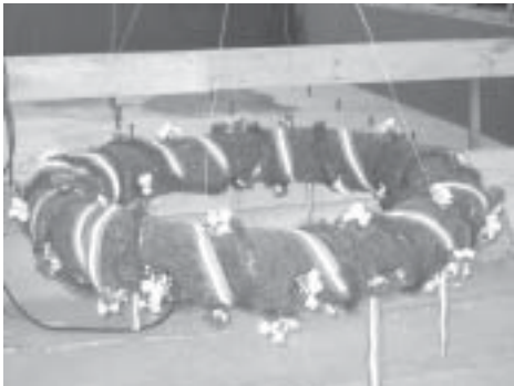
A „bokréta”, melyet a Brachna virágüzlet készített el