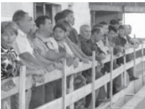
Az ünnepségen résztvevők egy része, közöttük az építők