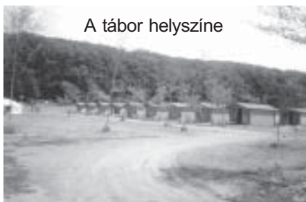
A tábor helyszíne

2003. június 23-29. között első alkalommal vehettek részt a monori általános iskolák legkiválóbb tanulói az önkormányzat által szervezett jutalomtáborban. A táborozás teljes költségét Monor Városi Önkormányzat