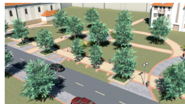
▲ A katolikus templom melletti Szent István tér is megújul