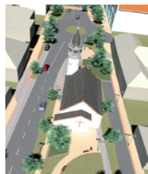
▲ Körforgalom a központban