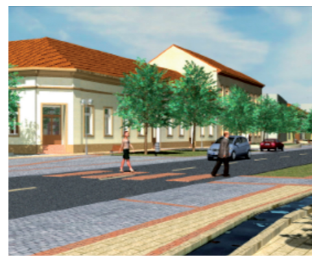
▲ Körforgalom a központban

▼ Új burkolatot kap a Kossuth L. utca a központban